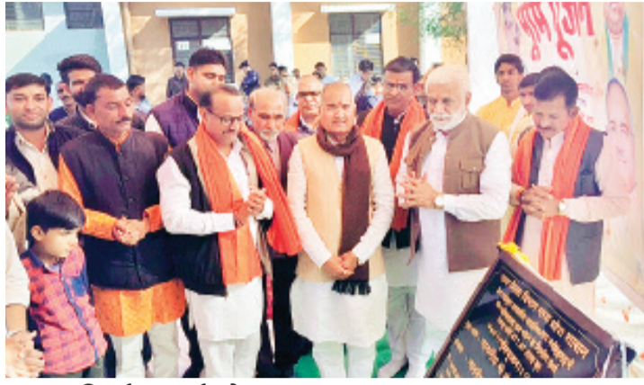
निर्माण कार्य को लेकर विधायक ने ठेकेदार को किया अलर्ट

भारत रत्न पूर्व प्रधानमंत्री स्व. अटल बिहारी वाजपेयी के शताब्दी वर्ष के उपलक्ष्य में शासकीय महाविद्यालय नरसिंहगढ़ को बड़ी सौगात मिली है। महाविद्यालय में लगभग चार करोड़ रुपये की लागत से चार आधुनिक प्रयोगशाला कक्ष भवनों का निर्माण किया जाएगा।