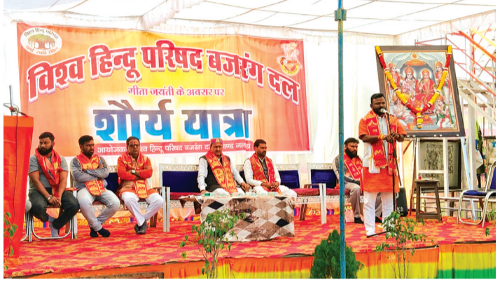
हरिभूमि न्यूज | नलखेड़ा

मंगलवार को नगर में विश्व हिंदू परिषद बजरंग दल द्वारा प्रभावी शौर्य यात्रा पद संचलन निकाला गया। नगरवासियों ने पुष्प वर्षा कर स्वागत किया। मंगलवार को विहिप बजरंग द्वारा नगर में शौर्य यात्रा पद संचलन निकाला गया। शिवाजी चौराहे से प्रारंभ हुई शौर्य यात्रा सरदार पटेल चौराहा, गणेश चौराहा, चौक बाजार, हनुमान मंडी, ठाकुर मोहल्ला, अशोक मार्ग, किला रोड, मुखर्जी मोहल्ला, काछी मोहल्ला, नयापुरा, गवलीपुरा, अंबेडकर चौराहा से रैन बसरा परिसर पहुंची। पद संचलन में दो घोष दल व ध्वज वाहिनी के साथ बड़ी संख्या में बजरंग दल के कार्यकर्ता शामिल थे जो कतारबद्ध होकर चल रहे थे। शौर्य यात्रा का नगर में स्थान स्थान पर नगरवासियों द्वारा पुष्प वर्षा कर स्वागत किया गया।